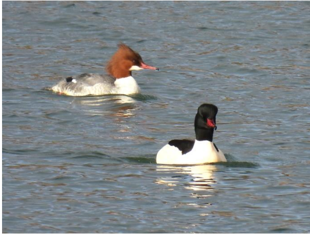
Stor Skallesluger hun og han.