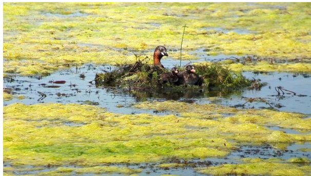
Lille Lappedykker på rede med unger ved fugleskjulet.

De seneste år har aftalen desuden omfattet optælling af rastende fugle på Bøtø Enge, som Flemming Olsen har håndteret både mht. optælling og rapportering, Også tak for det.